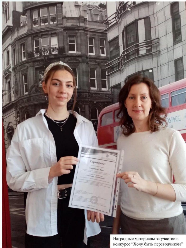
Наградные материалы за участие в конкурсе “Хочу быть переводчиком”