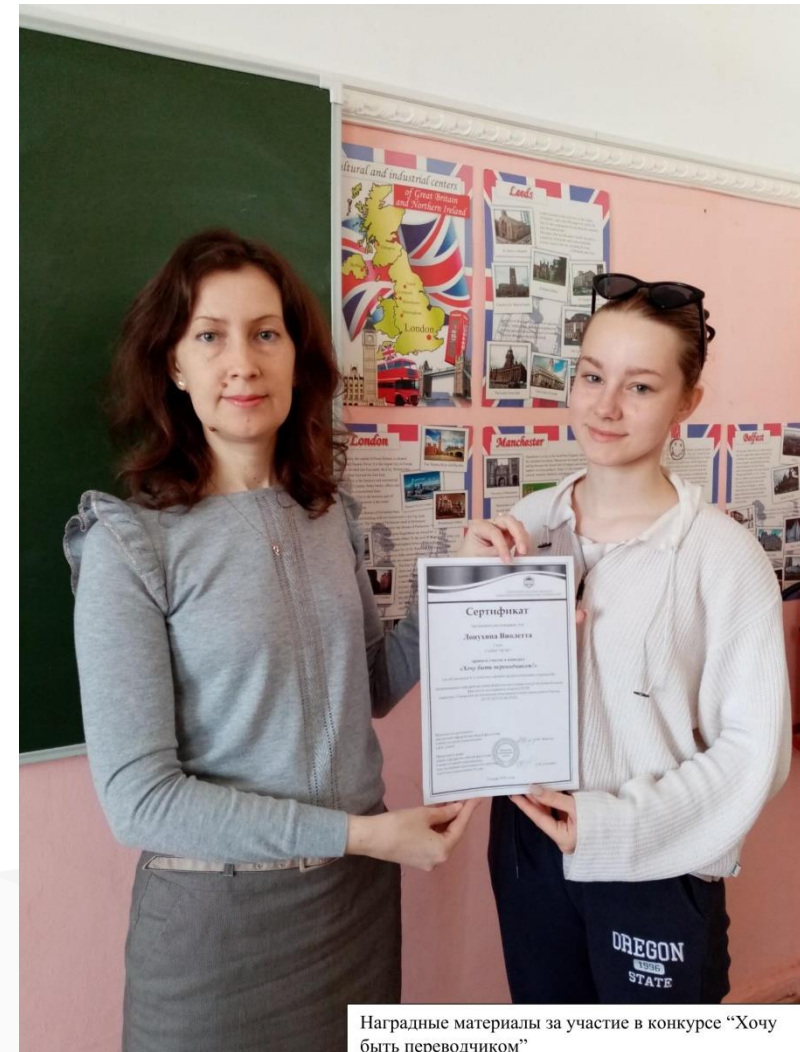
Наградные материалы за участие в конкурсе “Хочу быть переводчиком”