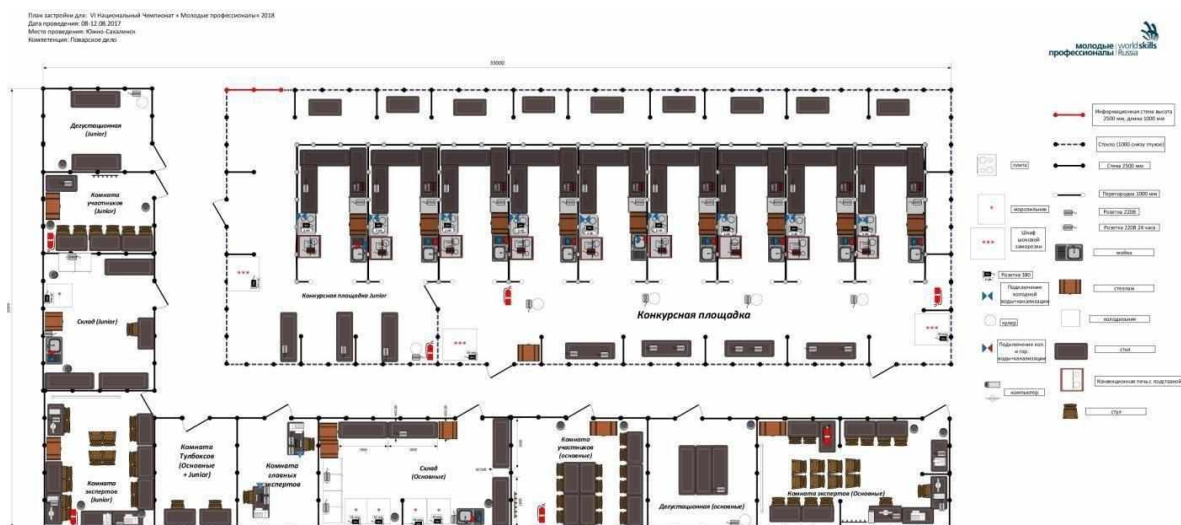
Схема конкурсной площадки (см. иллюстрацию).